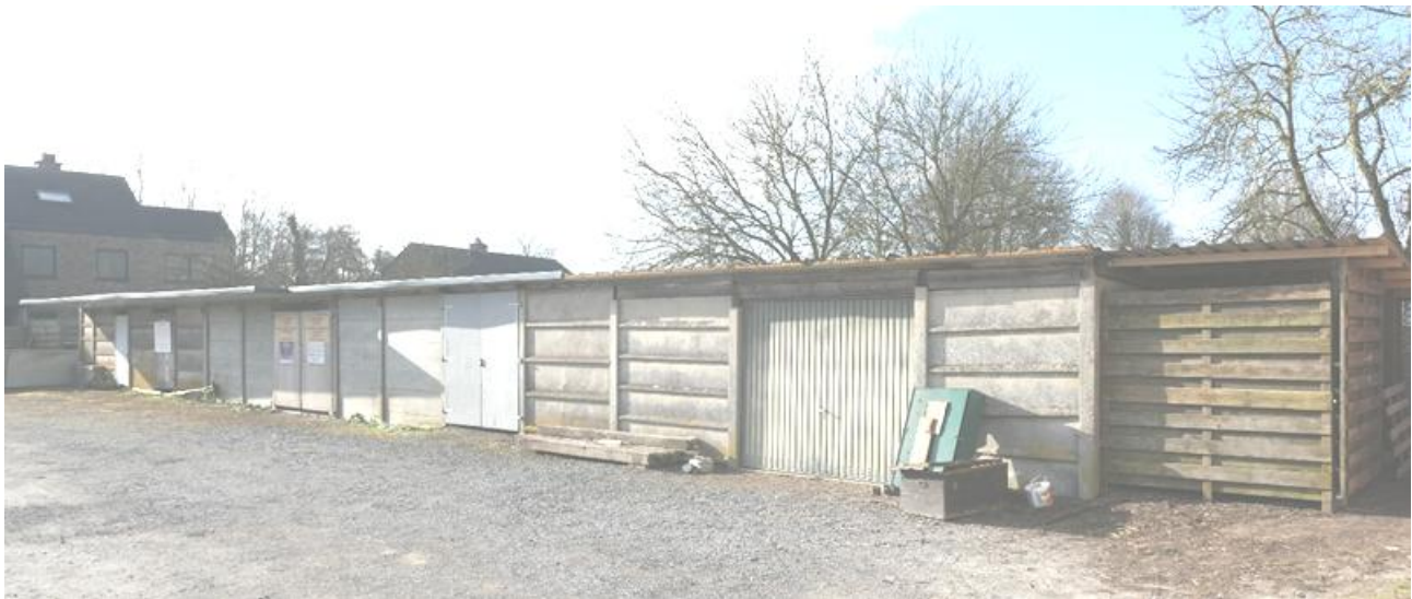
Een allerlaatste foto van het oud-papierhok. In een zijstraatje van het Pleintje van Ginderbroek. Een laatste gedeelte wordt omgebouwd tot wijklokaal.

Een nieuw buurtlokaal 'Hart van Ginderbroek', in het vroegere papierhok! Het wordt een straffe toer als dat gebouwtje kan gerealiseerd worden.