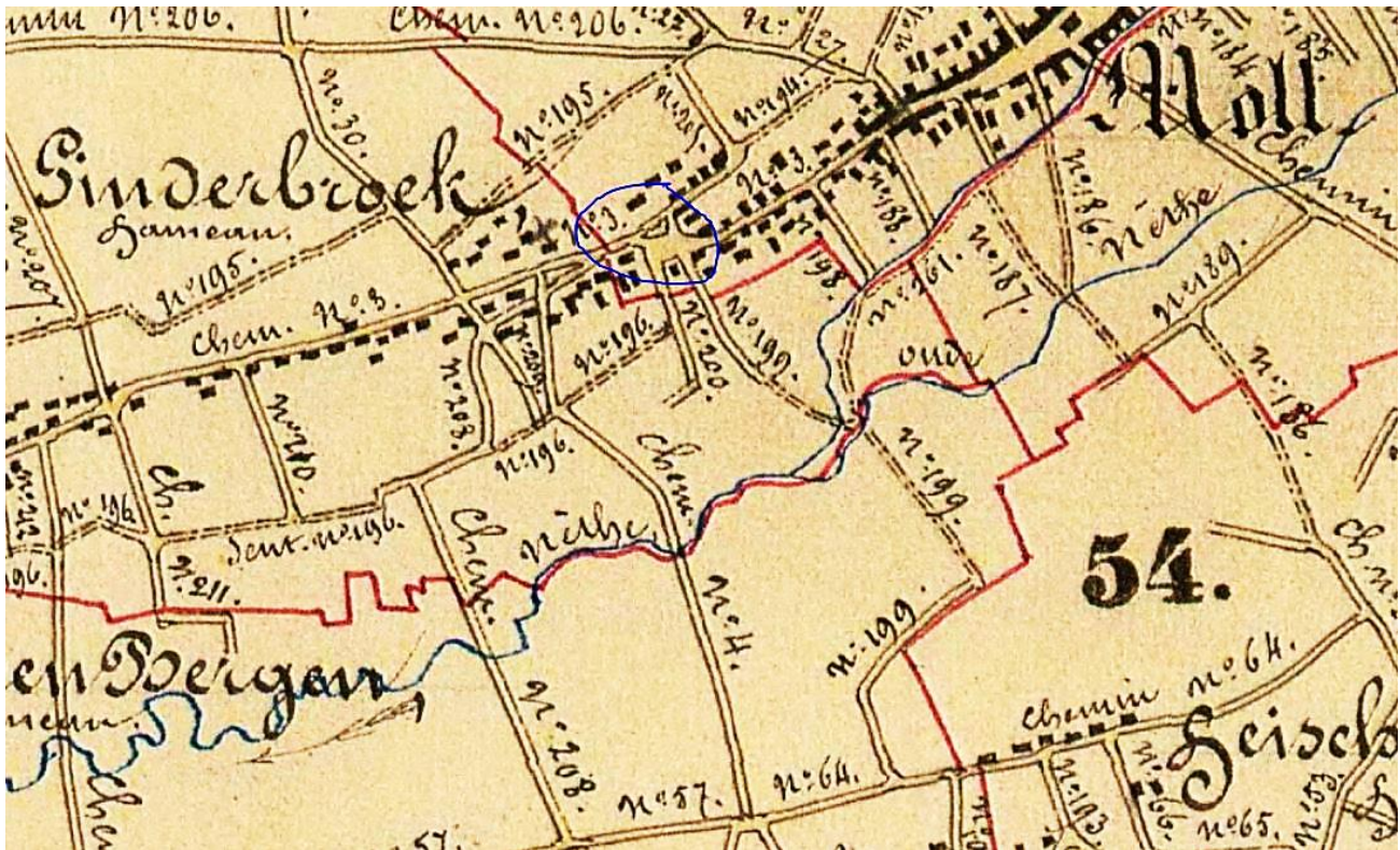
Kaart van Atlas der Buurtwegen