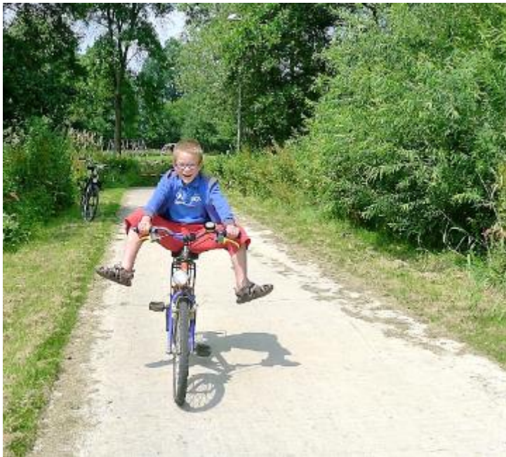
2013 - Het betonnen Hei- paadje voor de jolige jeugd