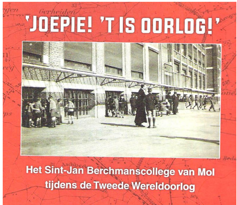
Het Sint-Jan Berchmanscollege van Mol tijdens de Tweede Wereldoorlog

Deze twee leerkrachten van het college zijn de auteurs.