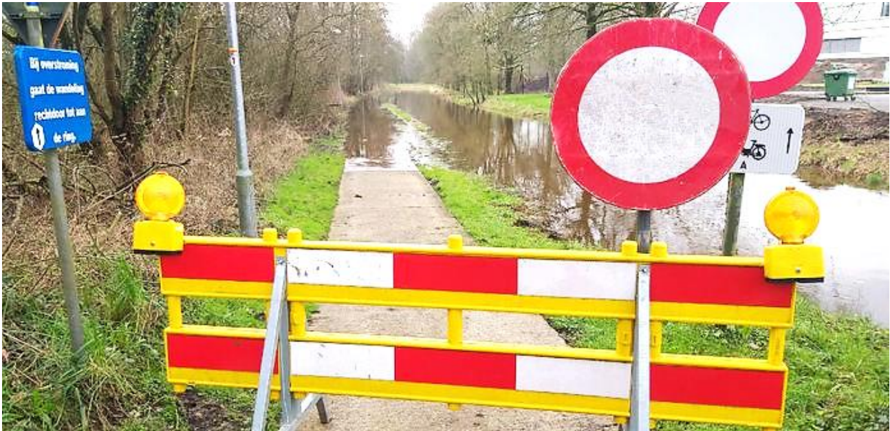
Geregeld staat het Heipaad onder water.

Het Heipad ligt langs de Oude Nete en in het natuurlijke overstroomingsgebied tot aan de Zuiderring. Bij hoge waterstanden stroomt het water over de laagste punten van het fietspad naar het overstroomingsgebied, waardoor men dan de fietsverbinding tijdens nattere periodes meerdere weken buiten gebruik moet stellen.