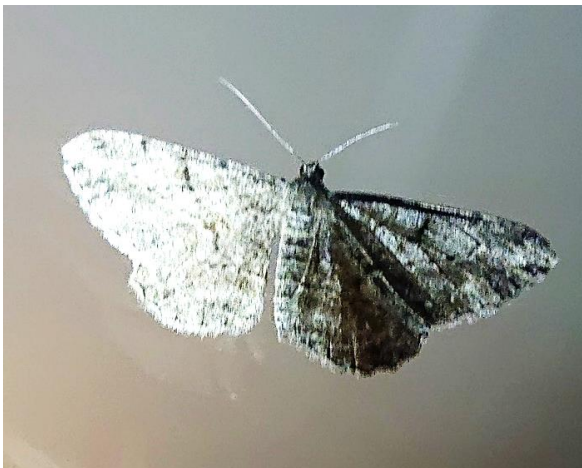
Taxusspikkelspanner Maurice, 2 sept. 2023

Deze invasieve exotische nachtvlinder-soort is per ongeluk vanuit Azië ingevoerd. Ze is voor het eerst in ons land opgemerkt in 2010 en is nu in diverse Europese landen een plaag geworden.