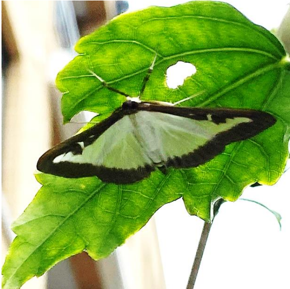
Buxusmot - Cydalima perspectalis An, 19 augustus 2023

Welke beestjes leven in onze Netevallei?