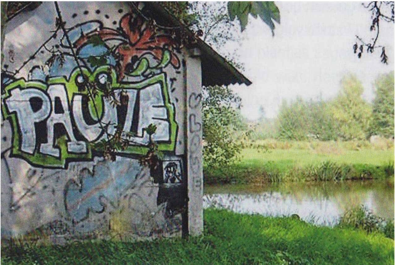
Pauze, aan de Molse Nete, in de achtertuin van Ginderbroek

We wensen jullie allen een deugddoende vakantie