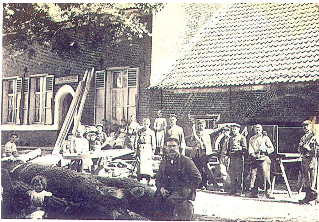
Moll. Hooghuis. Genebroek.

Nu hadden we graag een kaart uit 1617 willen publiceren, maar die hebben we niet, maar we geven wel iets beters in de plaats: een foto van het Hooghuis dat in 1617 is gebouwd. Een van de oudste woonhuizen van het land.