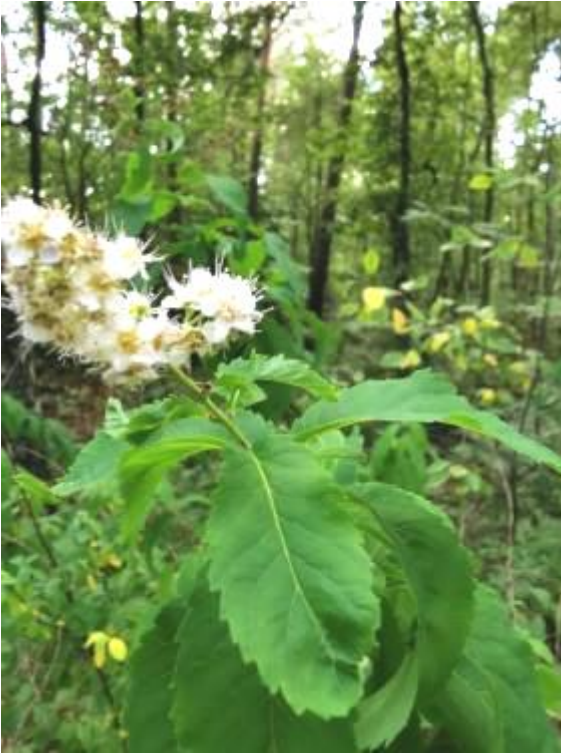
Struikspirea, door Walter op 6.8.2022