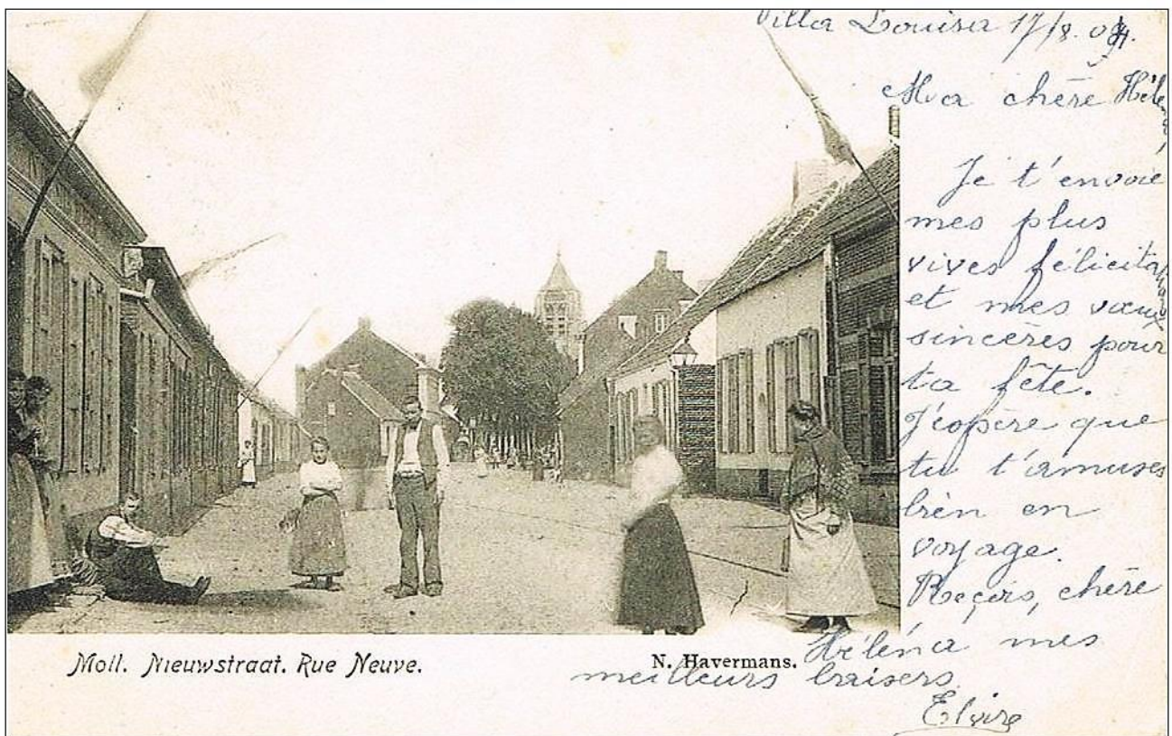
Moll. Nieuwstraat. Rue Neuve, 1903

Uit: Molse dorpszichten tot 1905 (In Perswinkel verkrijgbaar)