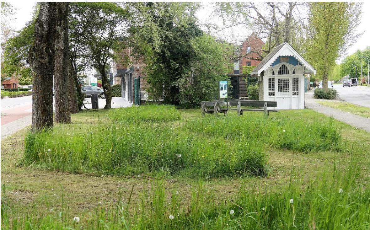
6 mei 2021: het structureel maaien aan het Muneskapel in de Martelarenstraat

De ecologische inspanningen van de gemeente gingen alvast niet onopgemerkt voorbij. In de categorie 'Gemeente'in bloei' won Mol onlangs de award omdat de gemeente in 2019 een vijftal perkjes opnieuw aanplante.