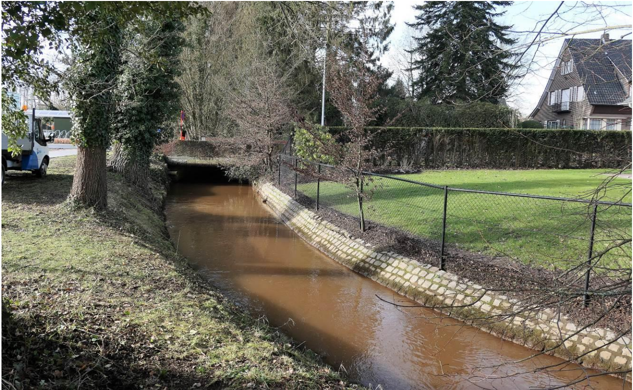
De brug (B3) over de Molse Nete aan de Rode Kruislaan of de weg naar de sporthal.