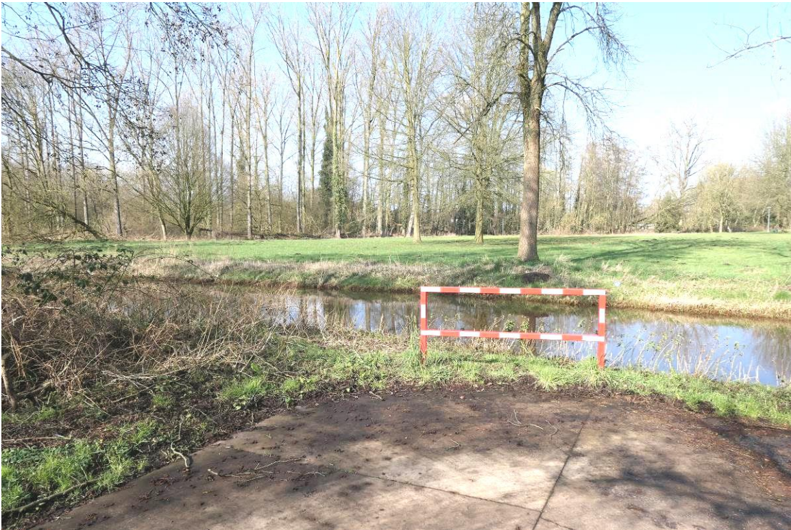
Hier lag het bruggetje van het Heipaadje (V2) over de Oude Nete. Op de achtergrond de ligweide, waar nu ook speeltuigen staan.