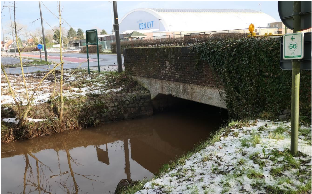
De brug (B4) van de Kleinendijk en de Rode Kruislaan over de Oude Nete, met op het achterplan de Sporthal Den Uyt en het nieuwe zwembad Vita.