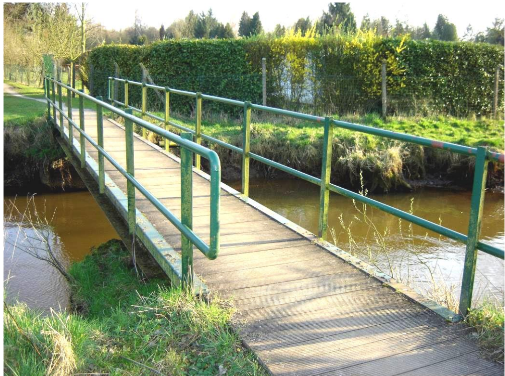
De nieuwe brug met een ijzeren gebinte en leuningen