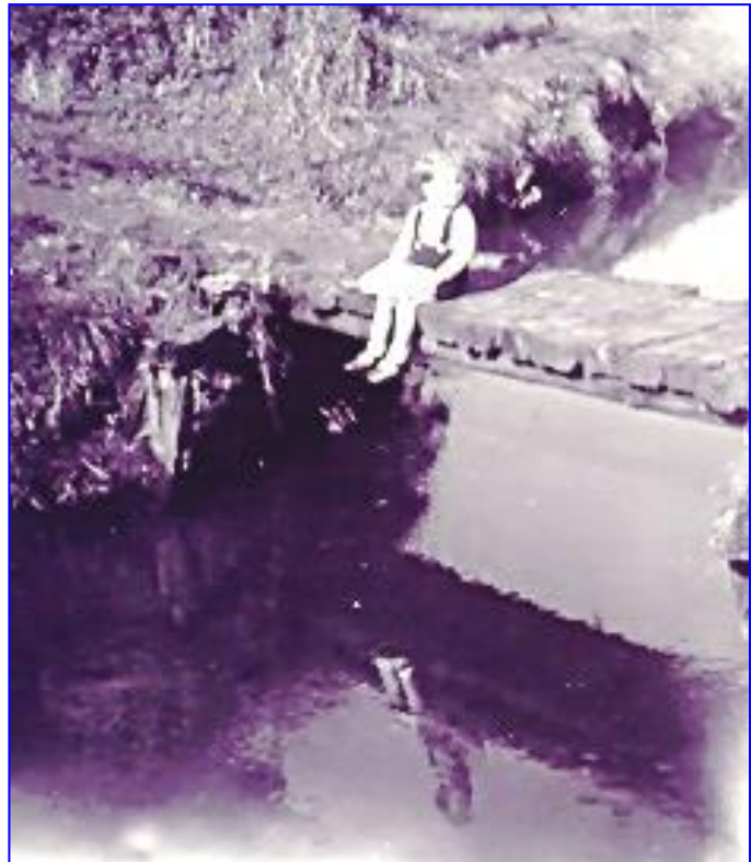
1945 - Het jongetje Rudy De Motte op het bruggetje (V1) van het Heipaadje over de Molse Nete