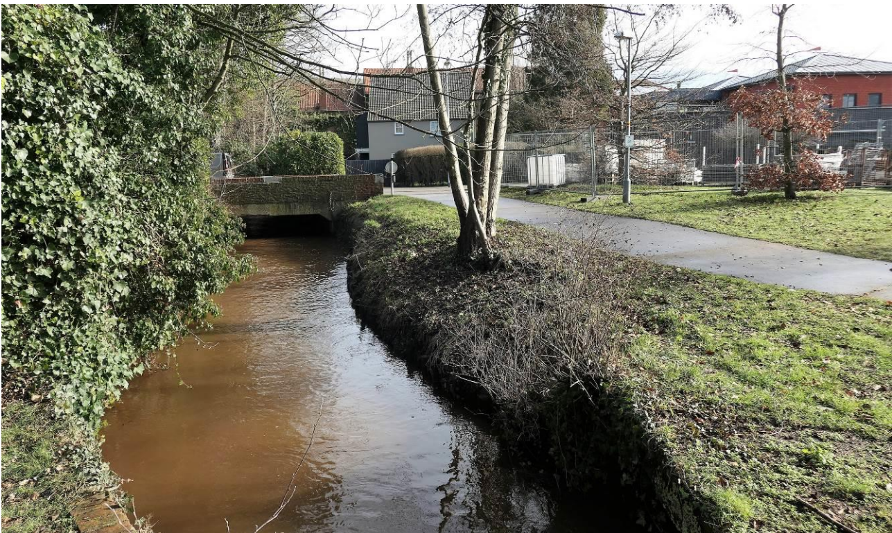
De brug (B5) van de Rivierstraat over de Molse Nete, naar de Markt, met op de achtergrond het rijksopvoedingsgesticht.