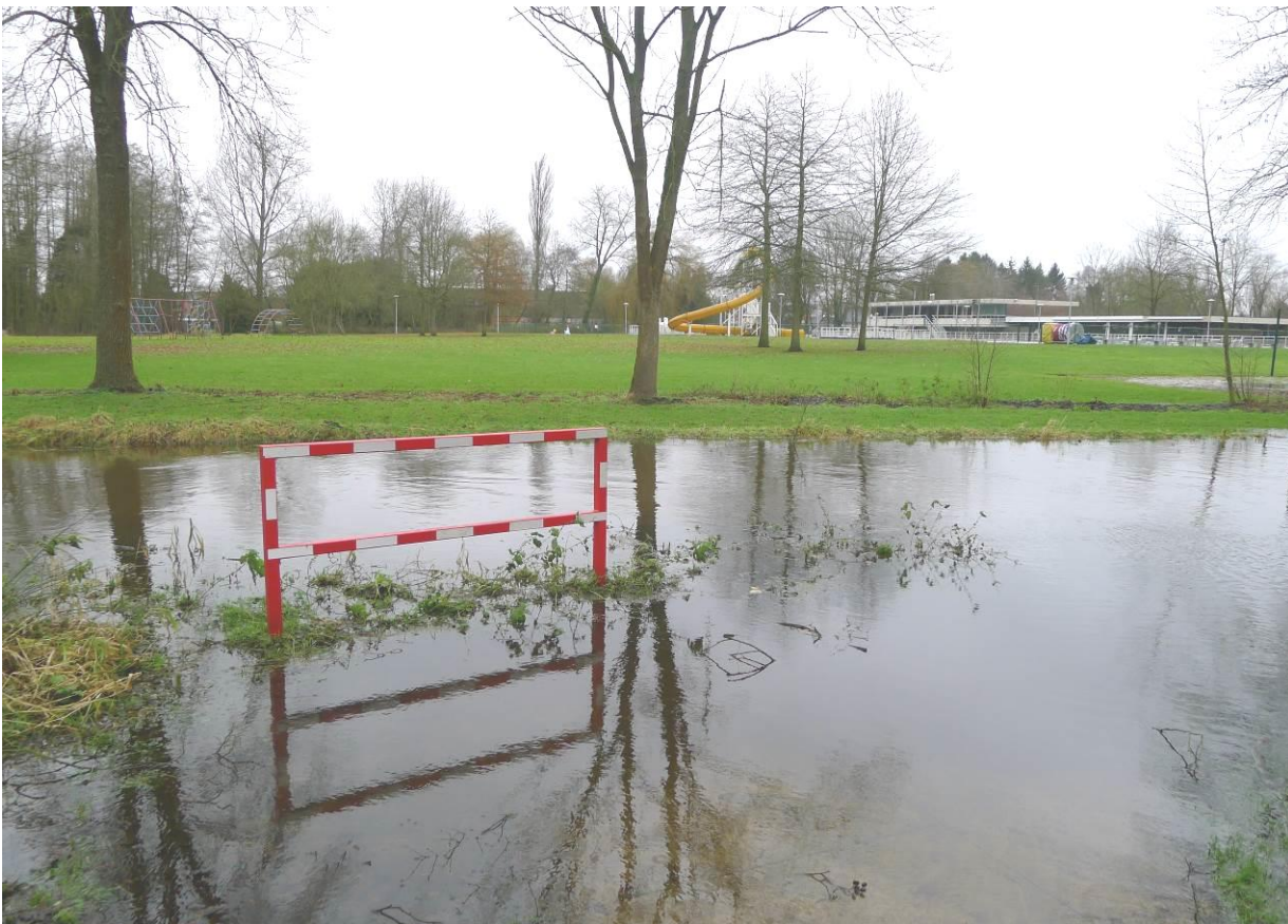
Geregeld staat het Heipaadje bij overstroming blank.