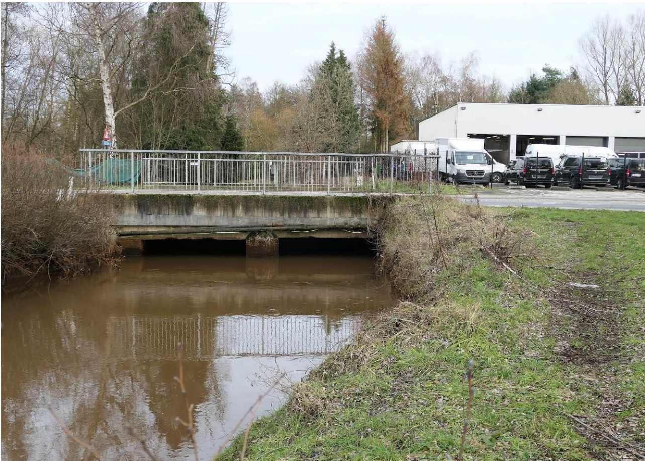
2021 – De brug van de Borgerhoutsendijk (B1) of de weg van Mol naar Meerhout, met rechts ervan de Mercedesgarage.