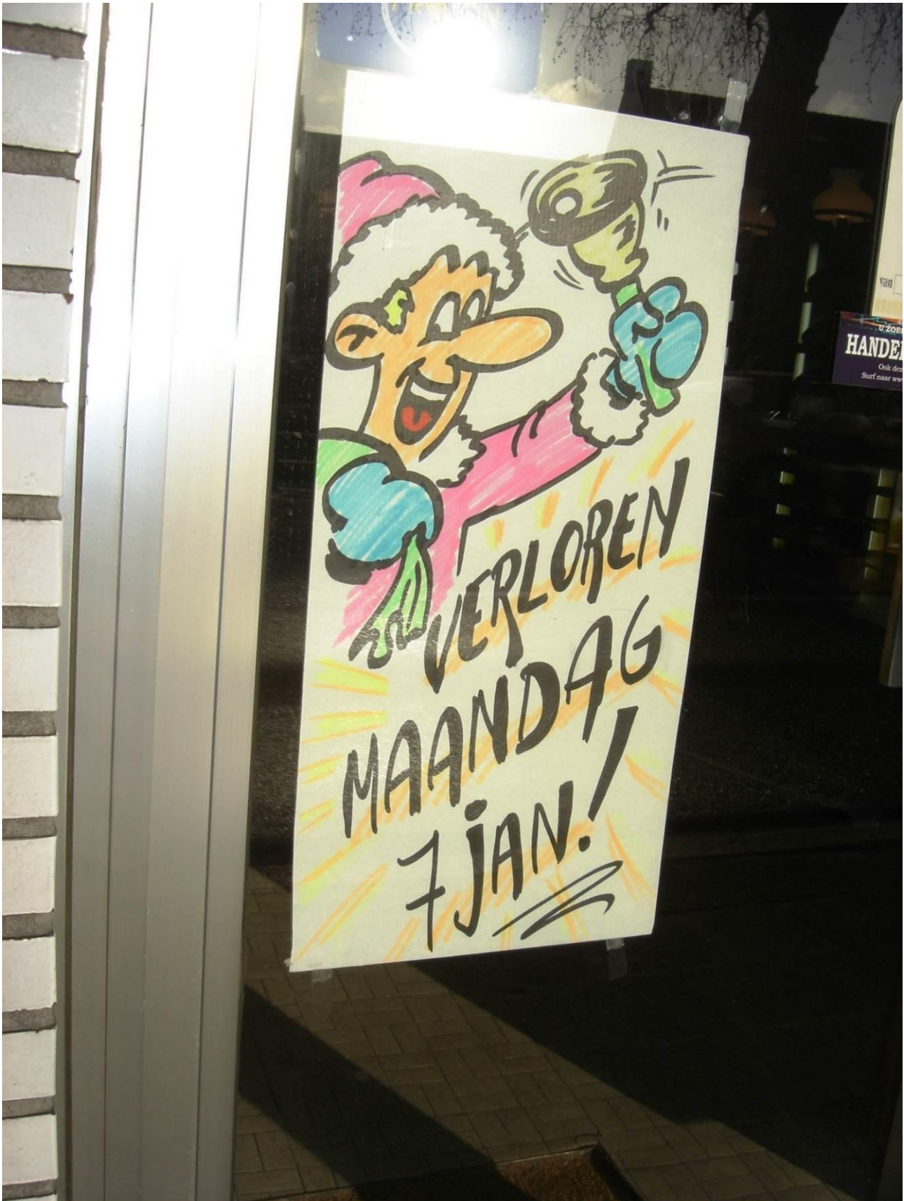
Worstenbrood bij bakker Dierckx op Verloren maandag, de eerste maandag na Driekoningen.