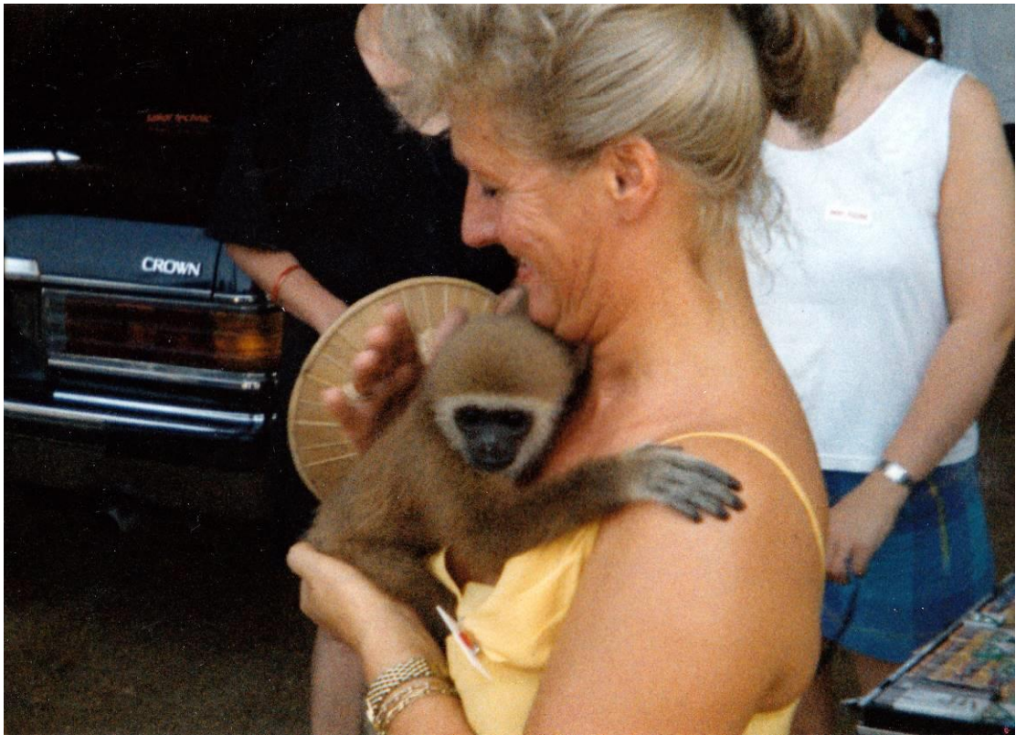
In Thailand Alfonsine met een snoezig aapje.