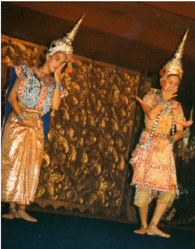
Thaise danseressen of dansers geven een voorstelling.