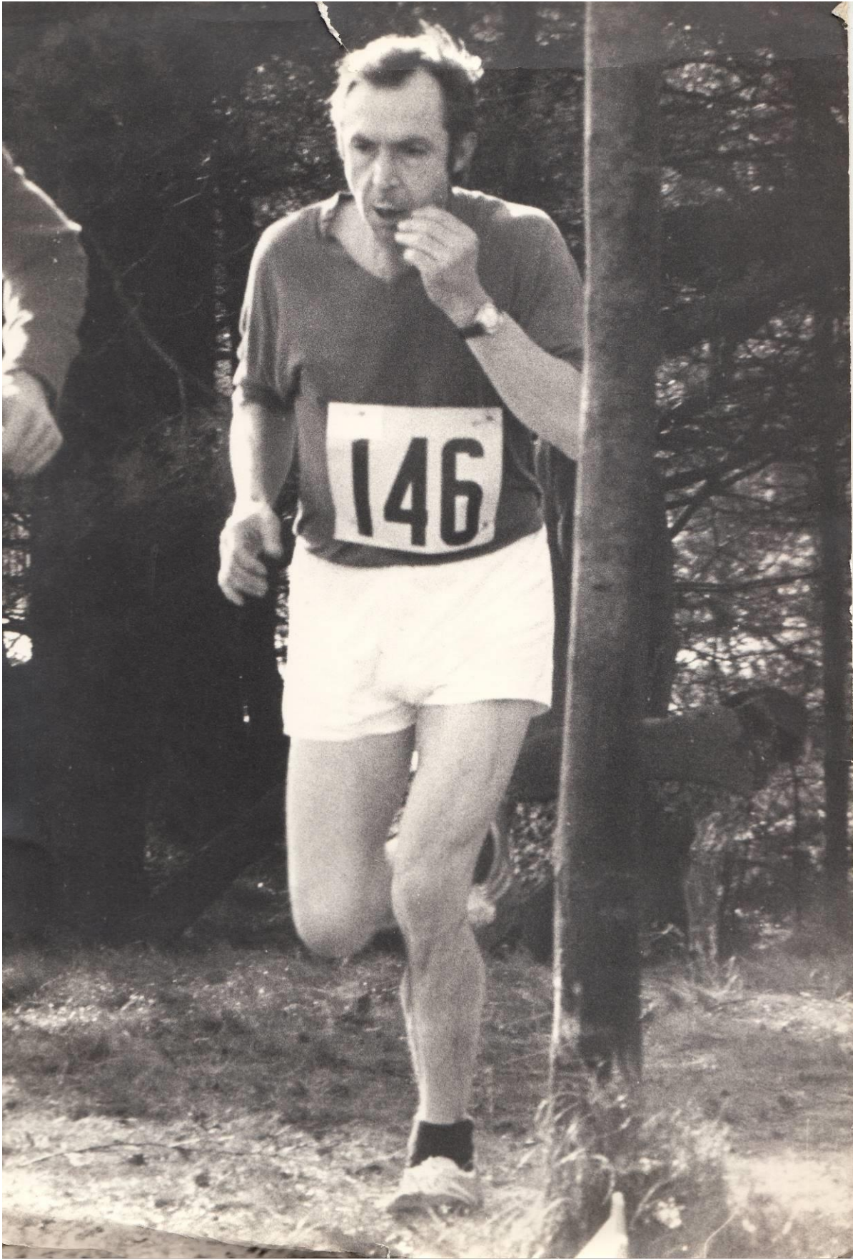
1975 - Veldloop Nuclea