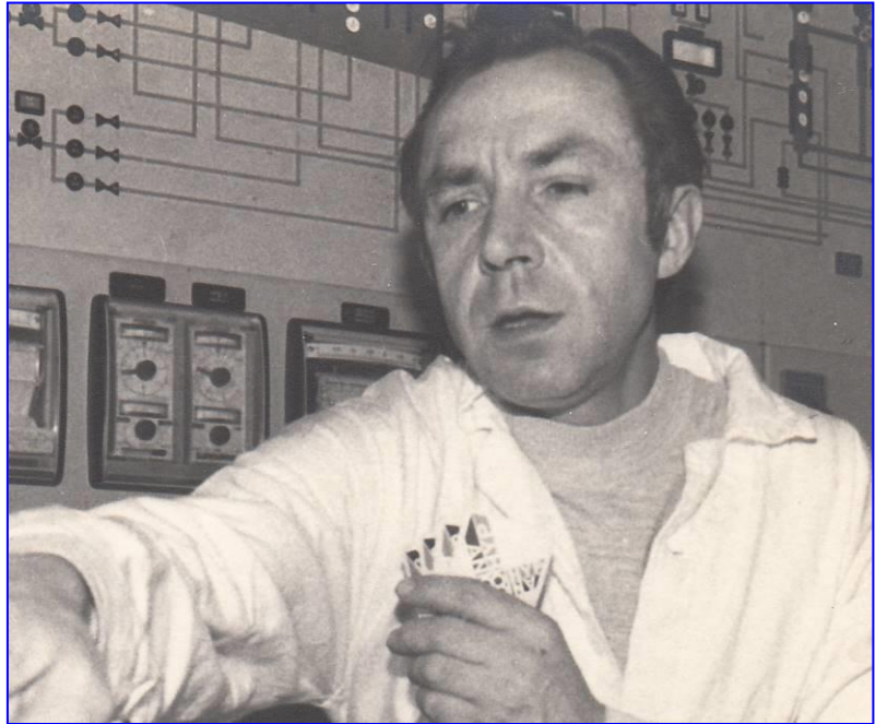
In de Eurochemie

Daarna werkte bij Eurochemie tot aan zijn pensioen.