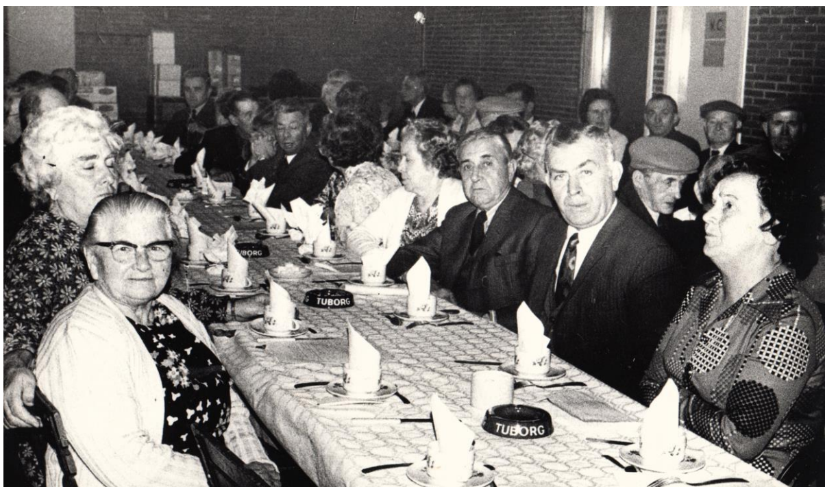
Feest Senioren in het Chirolokaal

De start in 1969 is meer dan geslaagd te noemen vooral dankzij de vele vrijwilligers die hun ideeën op tafel legden en ze uitvoerden.