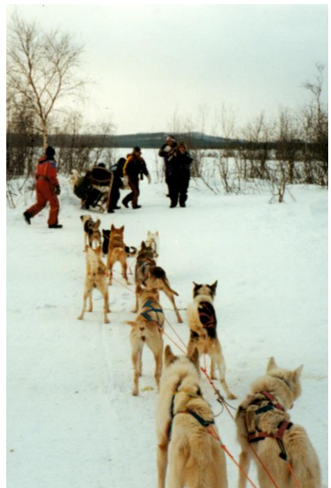
Op sleetocht door het Siberische landschap